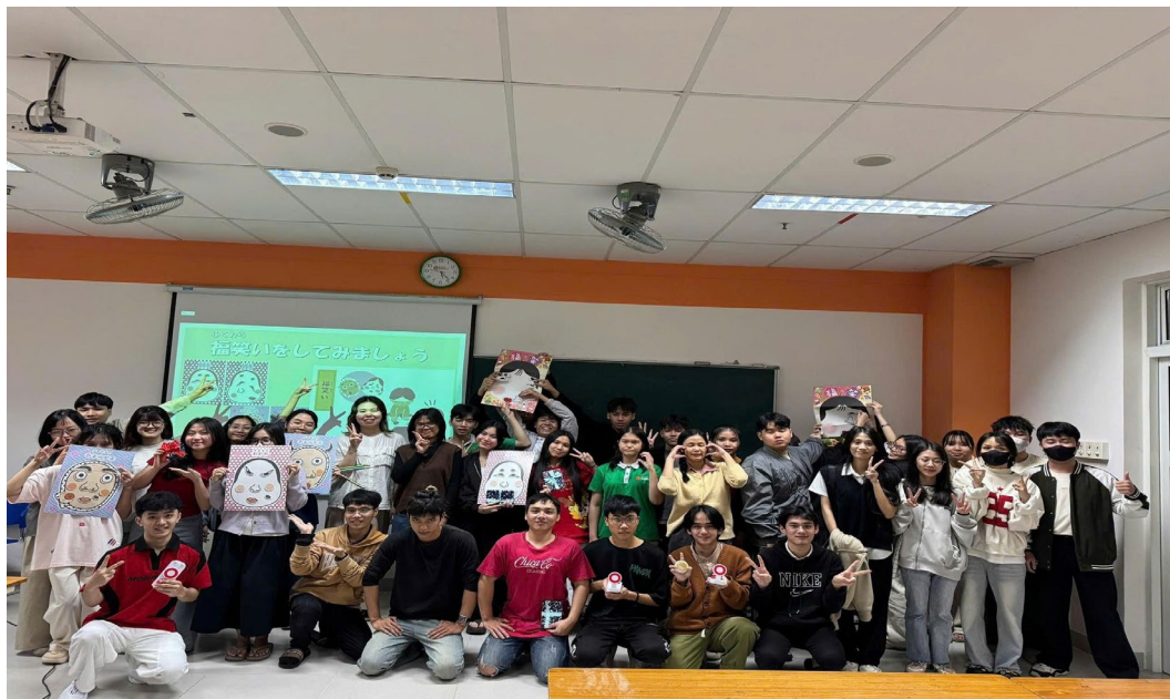
Hình 7: TRẢI NGHIỆM VĂN HÓA NHẬT BẢN