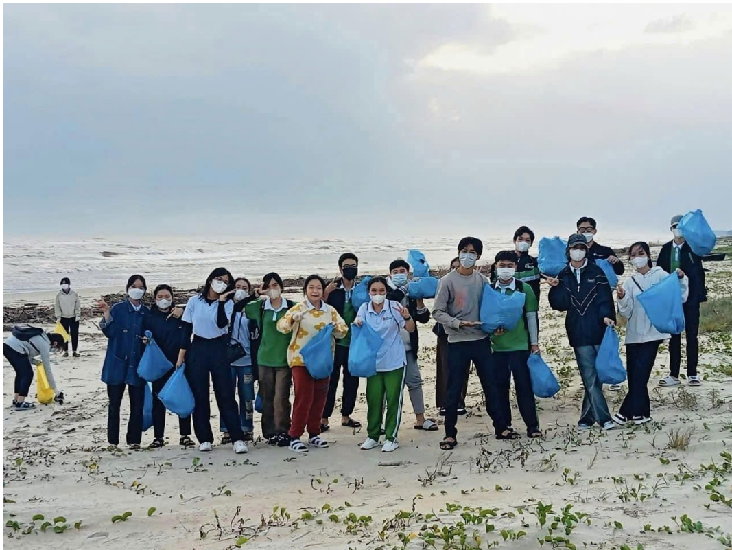
Hình 15: Dọn rác bãi biển