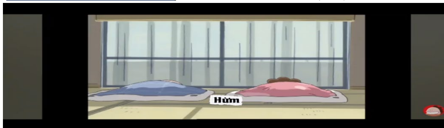
Hình 4: Tham Gia cuộc thi lòng tiếng Nhật