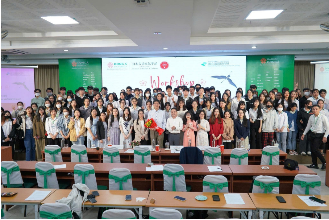
Hình 10: WORKSHOP XOAY QUANH VIỆC ĐỊNH HƯỚNG NGHIÊN CỨU TRONG LĨNH VỰC TIẾNG NHẬT