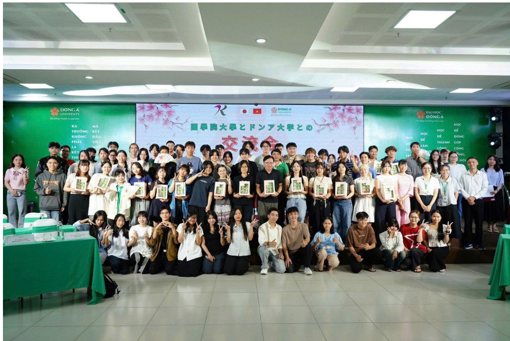
Hình 5: GIAO LƯU VĂN HÓA VIỆT – NHẬT