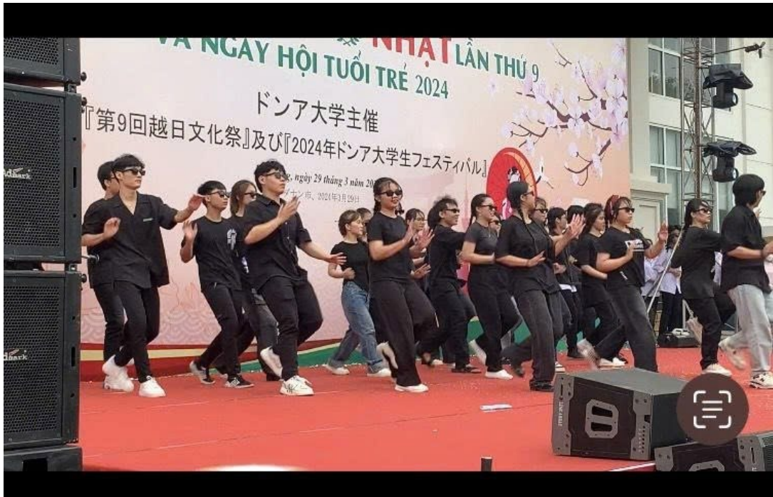
Hình 12: LỄ HỘI VIỆT – NHẬT LẦN THỨ 9