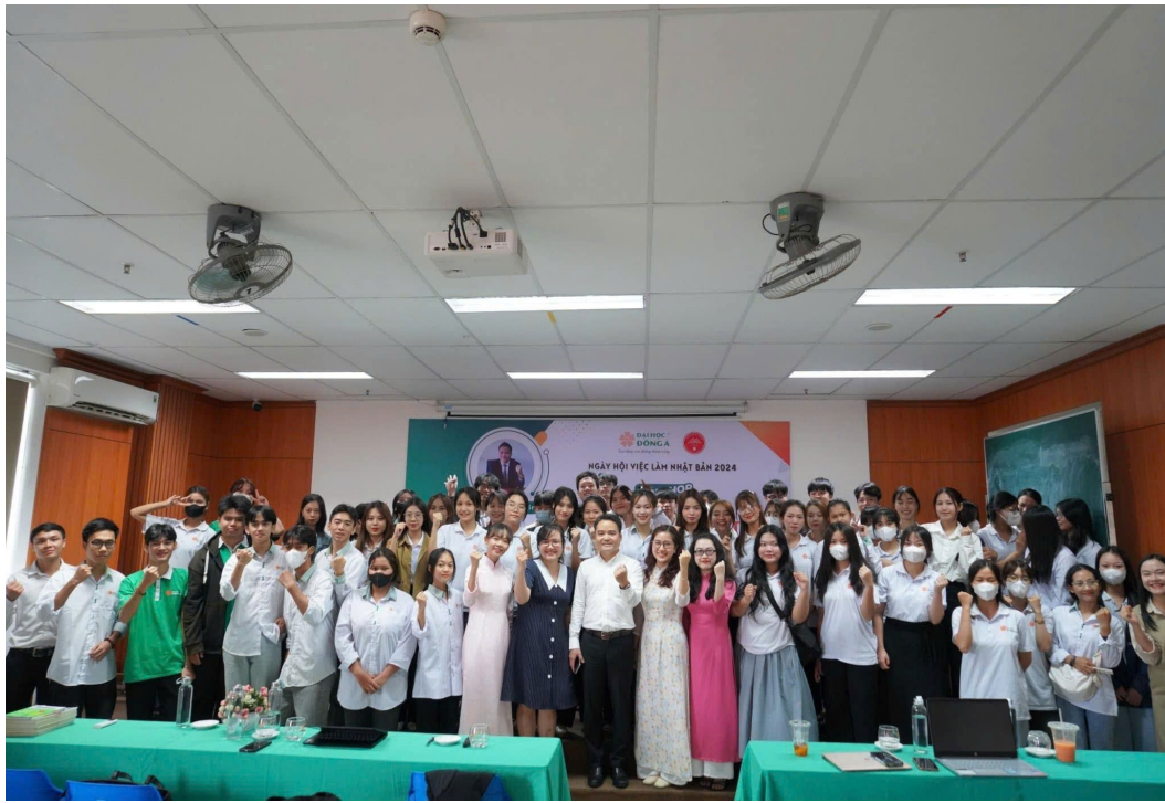
Hình 8: BUỔI WORKSHOP “BÍ KÍP CHINH PHỤC KỲ THI JLPT”