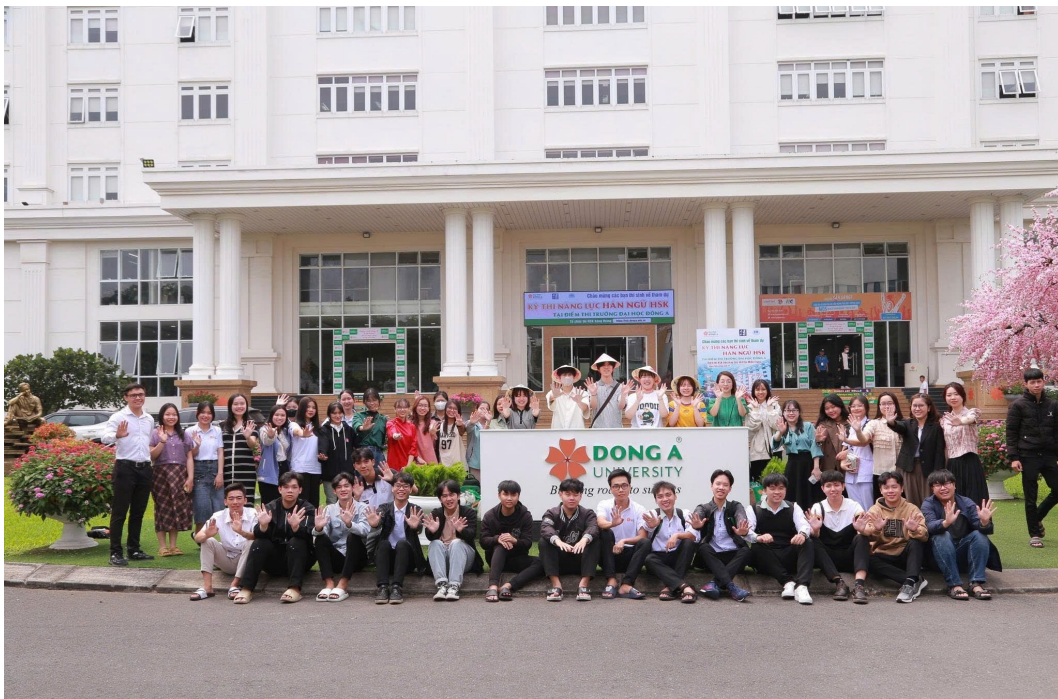
Hình 9: GIAO LƯU SINH VIÊN QUỐC TẾ