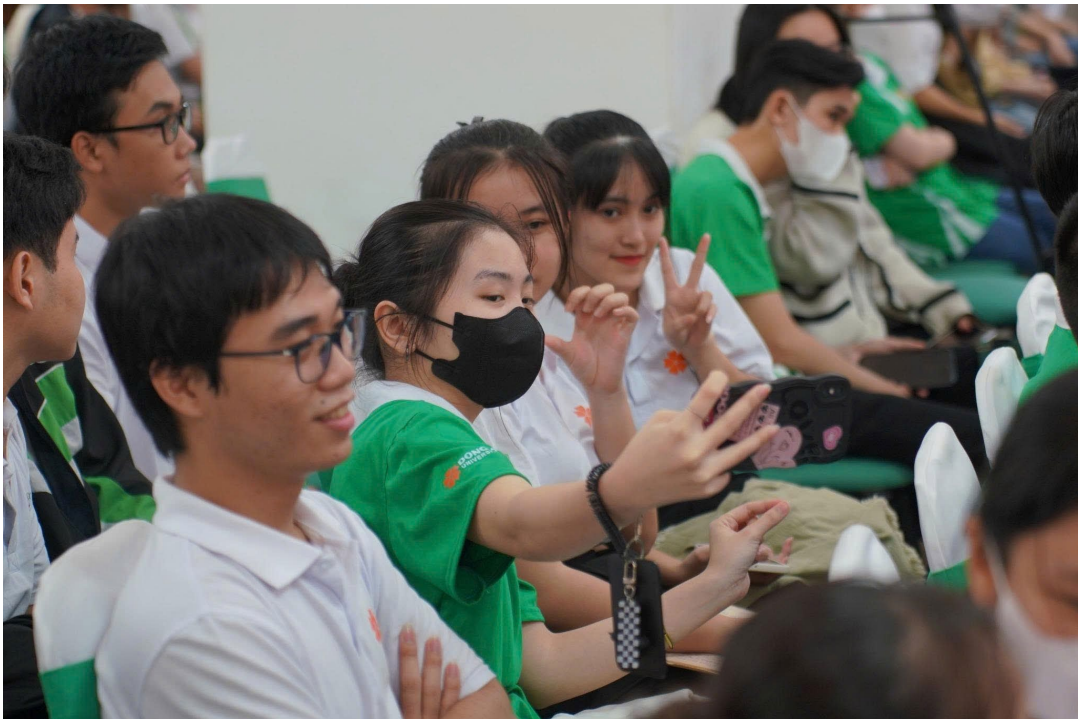
Hình 11: GIAO LƯU VỚI ĐOÀN LIÊN MINH NGHỊ SĨ HỮU NGHỊ VIỆT – NHẬT NGHỊ VIỆN TỈNH OSAKA