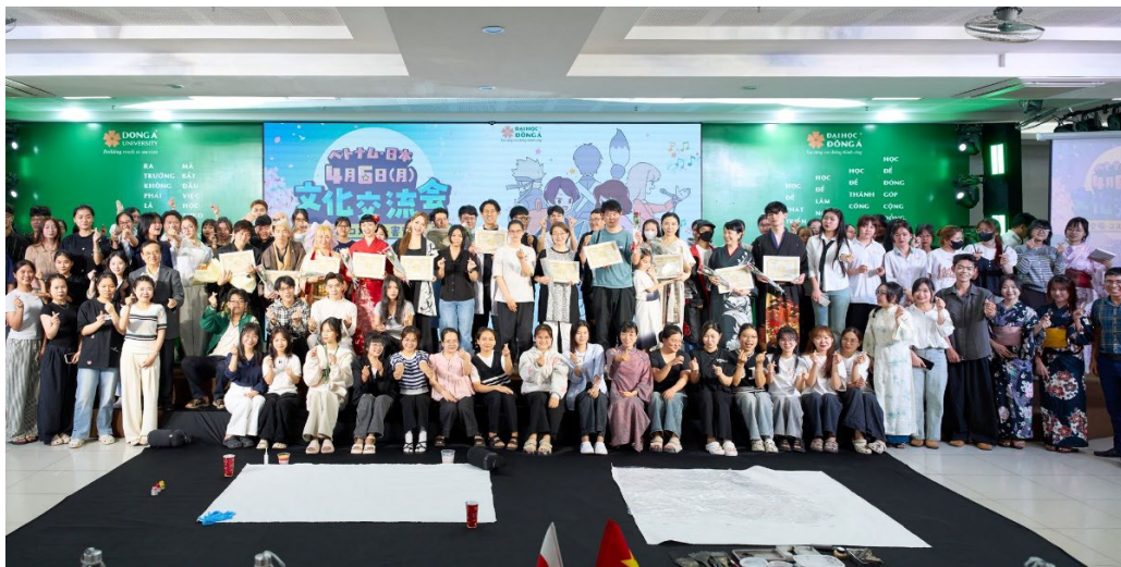
Hình 3: GIAO LƯU VĂN HOÁ CÙNG ĐOÀN NGHỆ THUẬT NHẬT BẢN