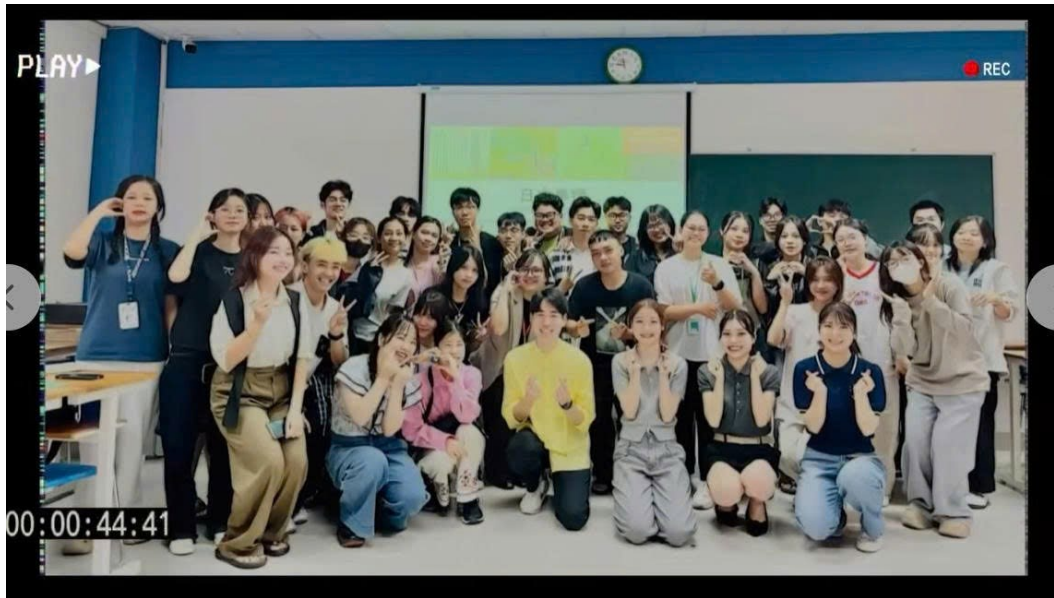
Hình 6: TRIỂN VỌNG THÀNH CÔNG KHI HỌC NGÀNH NGÔN NGỮ NHẬT TẠI ĐẠI HỌC ĐÔNG Á