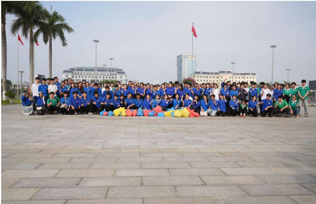
Hình 13 : Tham Gia chủ nhật xanh