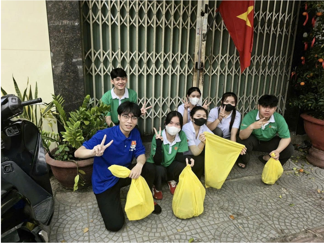
Hình 14: ĐI DỌN VỆ SINH ĐƯỜNG PHỐ