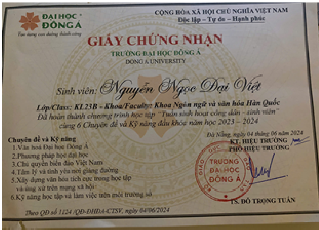
Hình ảnh 4: Giấy chứng nhận hoàn thành học tập đầu khóa sinh viên: