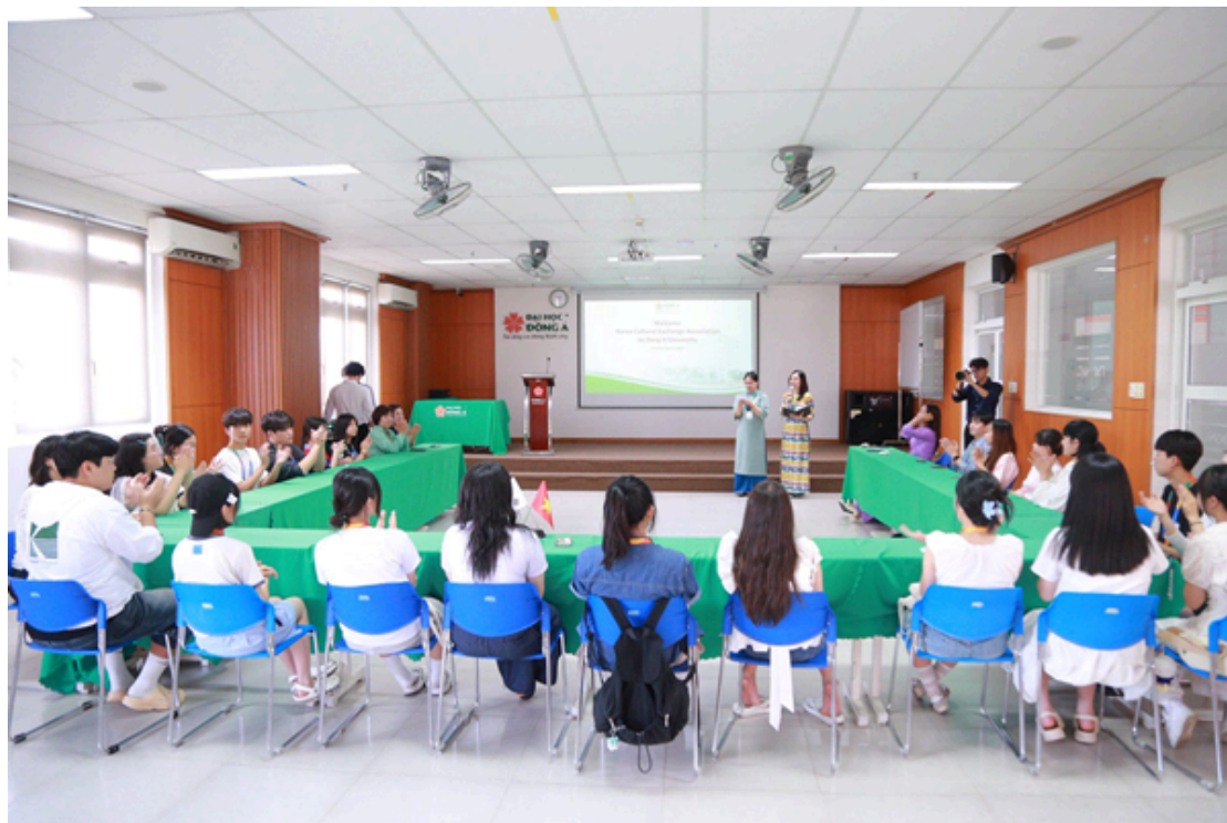
Hình ảnh 7: Giao lưu cùng sinh viên hàn quốc