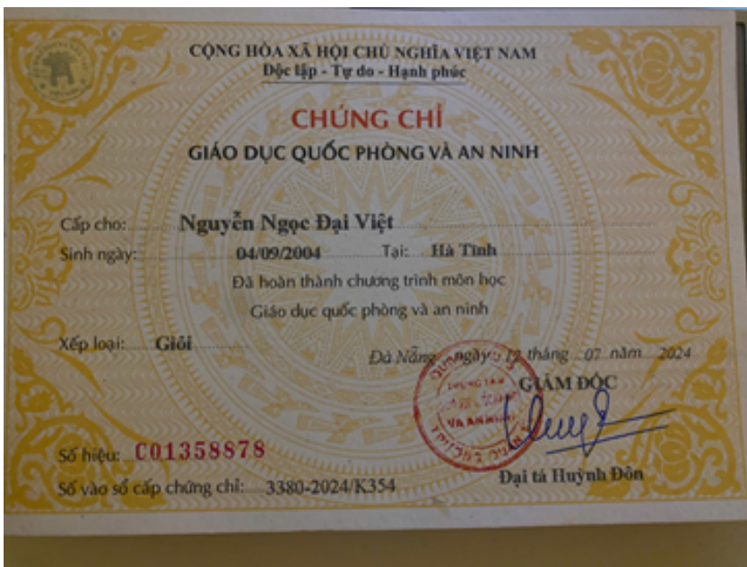
Hình ảnh 2: chứng chỉ quốc phòng