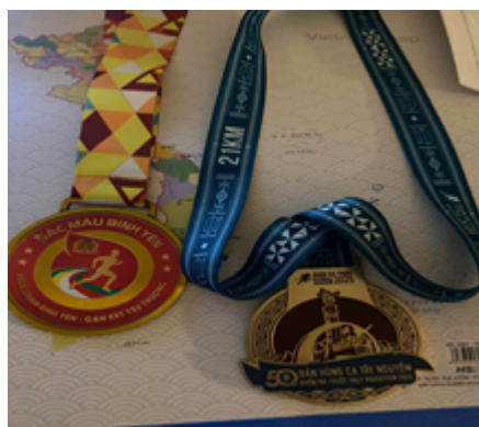
Hình ảnh 11: Giải chạy bộ cộng đồng