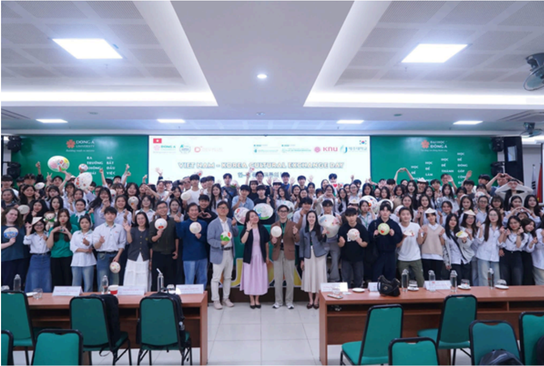
Hình ảnh 5: Giao lưu văn hóa Việt – Hàn

*Giao lưu văn hóa VIỆT – HÀN cùng sinh viên ĐẠI HỌC KEIMYUNG (계명대학교)