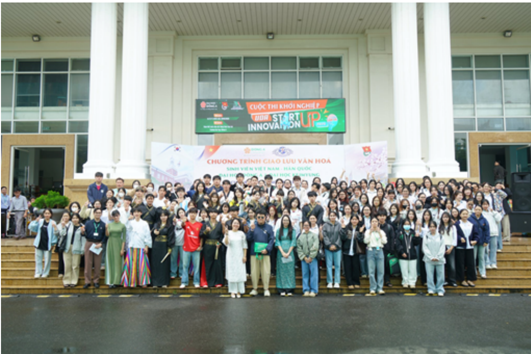
Hình ảnh 6: VIỆT – HÀN cùng sinh viên ĐẠI HỌC KEIMYUNG (계명대학교)

*Giao lưu văn hóa VIỆT – HÀN cùng sinh viên ĐẠI HỌC KEIMYUNG (계명대학교)