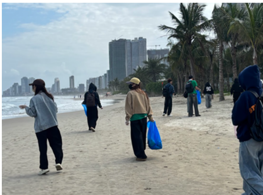
Hình ảnh 10 : Làm đẹp bãi biển